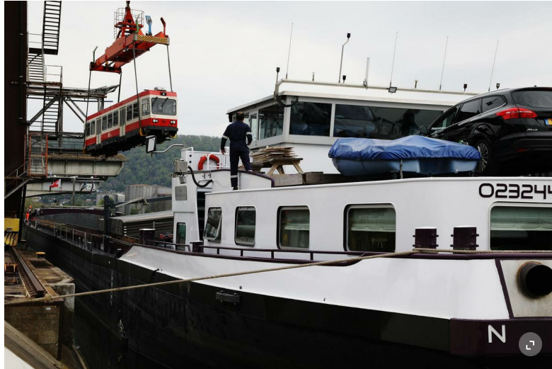
Die Amare ist ein Frachtschiff unter niederländischer Flagge.